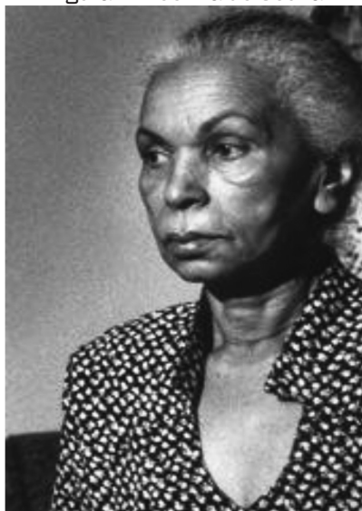
Figura 1: Noémia de Souza