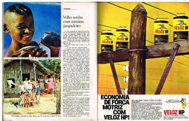
Figura 5: REALIDADE, Editora Abril, São Paulo, n. 2, p. 42-50, maio, 1966 (pp. 50-51)

Por fim, na última página (Figura 5), a imagem que se destaca é uma espécie de retrato da família, no qual grande parte dos familiares de Pedro se encontra em frente a uma casa de taipa, estruturada por meio do trançado de palhas e pedaços de madeira. Além disso, a reportagem é encerrada dando ênfase à imagem de uma criança feliz, neto de Pedro, carregando o peixe vindo recentemente do mar.