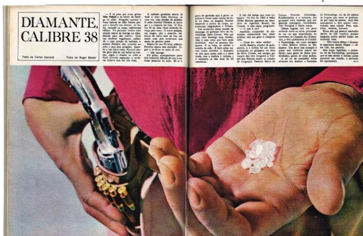
Figura 6: REALIDADE, Editora Abril, São Paulo, n. 4, p. 84-90, jul, 1966 (pp. 84-85).

De forma semelhante com o que falamos anteriormente, a imagem de abertura da reportagem intitulada “ Diamante, calibre 38 ”, de julho de 1966, é uma fotografia que ocupa cerca de três quartos das primeiras páginas. O espaço restante é ocupado por texto e, especialmente, com o título da matéria. Vale destacar que a fotografia trás três elementos principais: uma mão calejada pelo trabalho pesado, diamantes e uma arma embainhada com projéteis em destaque. Sendo estes os elementos que se ligam diretamente ao texto, no entanto, não se faz possível afirmar que o título tenha sido pensado tendo a imagem como referência (Figura 6).