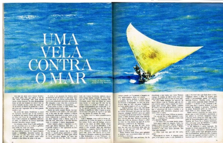
Figura 1: REALIDADE, Editora Abril, São Paulo, n. 2, p. 42-50, maio, 1966 (pp. 42 – 43)

A imagem de abertura da reportagem “Uma vela contra o mar”, realizada na praia de Canoa Quebrada, no estado do Ceará, ocupa cerca de dois terços da página dupla, deixando apenas uma faixa de texto abaixo do mar azul. As letras do título estão sobrepostas à imagem, na cor branca e em uma espécie de simetria com a página seguinte, onde, também num tom mais claro (tendendo para o amarelo), está uma jangada. Texto e imagem dialogam diretamente, especialmente no que tange ao título (Figura 1).