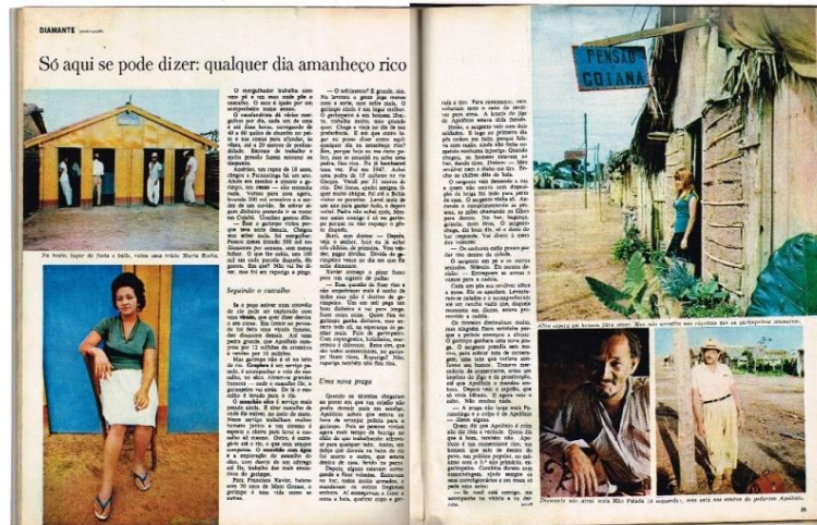
Figura 8: REALIDADE, Editora Abril, São Paulo, n. 4, p. 84-90, jul, 1966 (pp. 88-89).

Por fim, uma página que não faz uso de fotografias, carregada apenas por texto, na qual é descrito um garimpeiro que “Tem dívidas, ganha pouco [...], triste, pedindo notícias do Brasil” (AZEVEDO, 1966, p. 90). Ainda nesta página existe um box, no qual são apontadas ‘as faces do diamante’. O texto começa e termina com a mesma frase: “É só pena que avoa” (AZEVEDO, 1966, p. 84), atribuída a um personagem local conhecido como Mão Pelada.