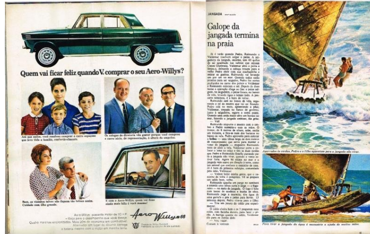
Figura 4: REALIDADE, Editora Abril, São Paulo, n. 2, p. 42-50, maio, 1966 (pp. 48 – 49).

salgadura do peixe e mesmo a volta a terra, as imagens já retratam a jangada sendo manobrada e levada à praia.