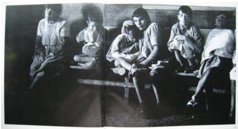
Figura 1 1

Esta denúncia contra a ditadura dos padrões de comportamento feita por Cortázar é muito semelhante à crítica de Theodor W. Adorno a propósito das monstruosidades do nazismo, quando diz, contra o assassinato de anciões: “Mesmo as esquisitices e aberrações neuróticas dos adultos envelhecidos representam o caráter, o humanamente bem sucedido, quando comparados com a pseudo-saúde do infantilismo erigido em norma” (ADORNO, 2008, p. 18).