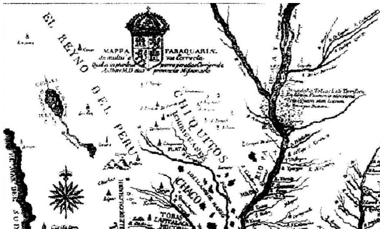
Mapa de Chiquitos

En las regiones de frontera, la manera de perpetuar la esclavitud y lucrar con la venta de indígenas fue posible gracias al argumento de “la Guerra Justa” contra los grupos que se enfrentaban a los colonos y se resistían a la evangelización. Hasta finales del siglo XVII se realizaban entradas en territorios donde vivían los grupos aún no colonizados y una vez derrotados eran esclavizados con el consentimiento de las autoridades coloniales y de los religiosos. En el siglo XVIII, los ataques de los “infeles” a los asentamientos rurales, perpetuaron las entradas en su territorio aunque también se instauraron épocas de paz donde se realizaban intercambios con los grupos rebeldes.