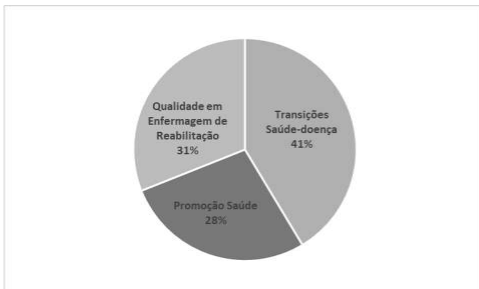
Figura 3 - Foco das temáticas dos estudos em análise.