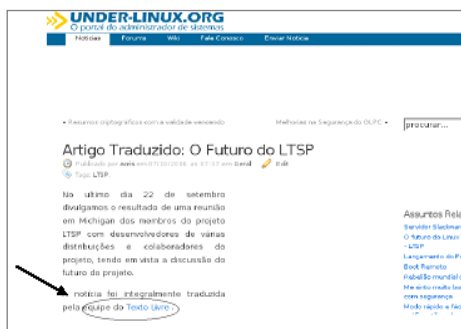
Fig. 2: texto traduzido e publicado com o nome do projeto e autores (alunos)