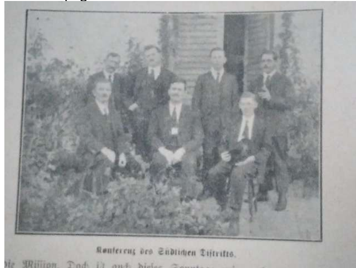
Fotografia 5 - Publicada na página 42 do Luther-Kalender de 1928 - “Conferência Distrital Sul”.