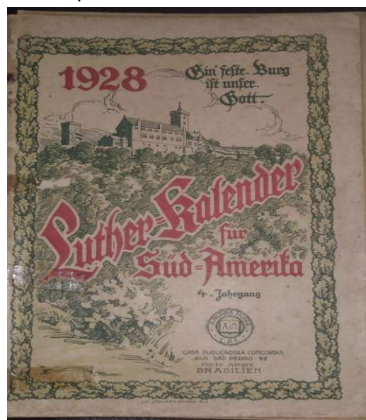
Figura 1 - Capa da Revista Étnica Luther-Kalender