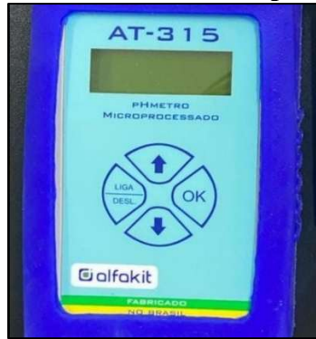
Figura 3 - pHmetro AT 315 SP Microprocessado (Alfakit)