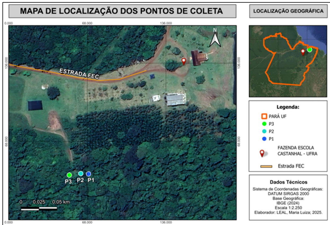
Figura 1 - Mapa de localização dos pontos de coleta