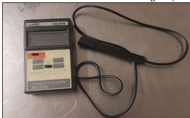
Figura 4 - Condutivímetro MOD. CD-850 digital (Instrutherm)