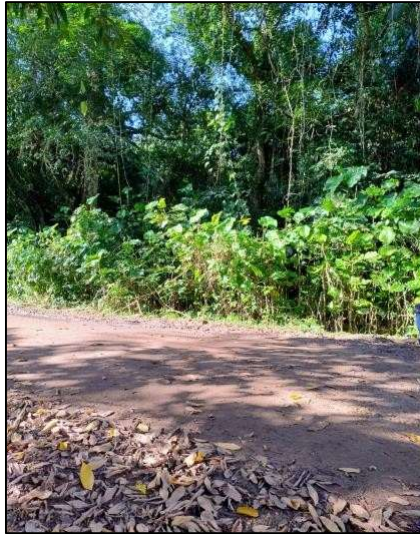
Figura 2 - Estrada da várzea