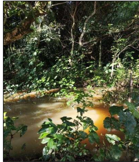
Figura 10 - Vegetação no leito P1