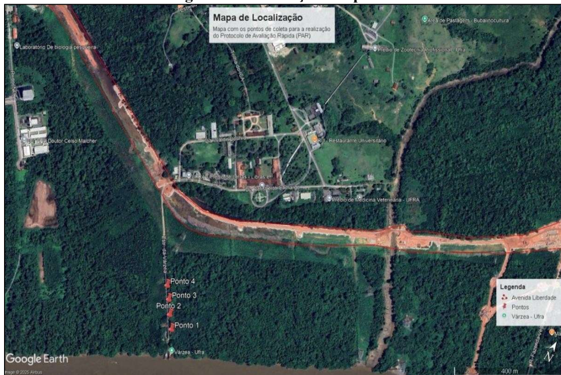
Figura 1- Localização dos pontos

A margem direita do córrego é utilizada para deslocamento de veículos e pessoas, e seus arredores atualmente encontram-se em processo de alteração devido às obras de construção de uma nova avenida, o que amplia a pressão antrópica sobre o ambiente. Essa característica torna o córrego um ponto estratégico para a aplicação do Protocolo de Avaliação Rápida (PAR), possibilitando avaliar os efeitos ambientais associados tanto ao uso cotidiano da área quanto às modificações resultantes da urbanização.