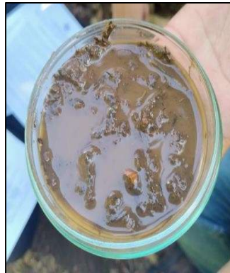
Figura 7 - Substrato P1