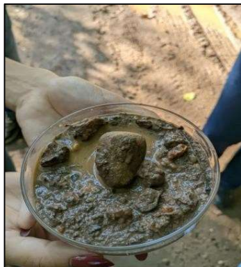
Figura 6 - Substrato P3

Esses impactos na vegetação ciliar refletem diretamente nos indicadores de qualidade do curso d'água. Foram observadas pontuações baixas nos parâmetros relacionados à deposição de lama, tipo de substrato (Figuras 6 e 7), tipo de fundo e transparência da água (Figura 8) evidenciando a ocorrência de assoreamento e turbidez, além da formação de um fundo lodoso em diversos trechos. Esses sinais indicam que a redução da vegetação marginal compromete não apenas a integridade da margem e do leito, mas também a qualidade ambiental geral do córrego.