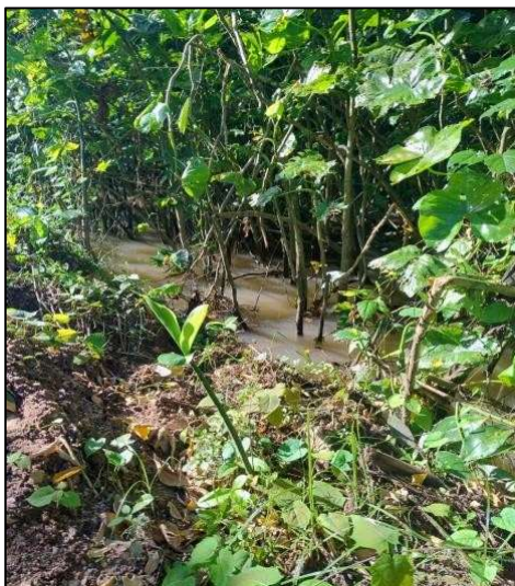
Figura 4 - Margem no Ponto 1

A mata ciliar corresponde a uma formação vegetal de origem natural localizada nas margens de rios, lagos, nascentes e represas, desempenhando papel essencial na proteção dos recursos hídricos e na conservação dessas áreas (Silva; Vieira, 2023). Além de contribuir para a qualidade da água e do solo, a mata ciliar regula os ciclos hidrológicos e mantém a biodiversidade local. Segundo Andrade (2018) a vegetação presente nos leitos e nas margens dos aquíferos são importantes para estabilizar o substrato, reduzir a erosão e fornecer abrigo e alimentos para a fauna aquática. A supressão dessa vegetação, associada à movimentação do solo e à impermeabilização das margens, favorece o aumento da erosão, a instabilidade das margens e o carreamento de sedimentos para o leito do rio, como ilustrado nas Figuras 3 e 4.