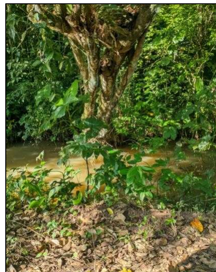
Figura 5 - Margem no Ponto 3