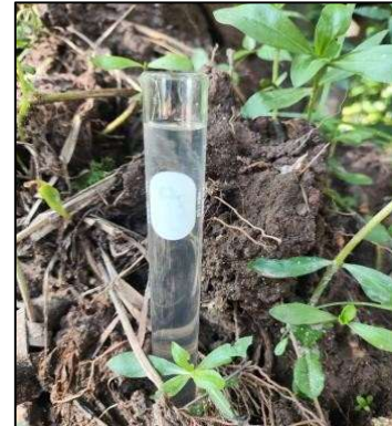
Figura 8 - Água do córrego