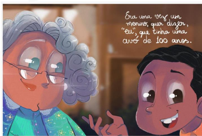
Figura 2: Minha avó de 100 anos

netos e descendentes. Na sequência, na página que dá início à história propriamente dita, a narrativa em si revela a conexão que se processa entre o texto e a imagem dando ao livro ares de modernidade, ainda que a narrativa seja iniciada pelo clássico: “Era uma vez...” (DICHOFF, 2021, p. 6-7).