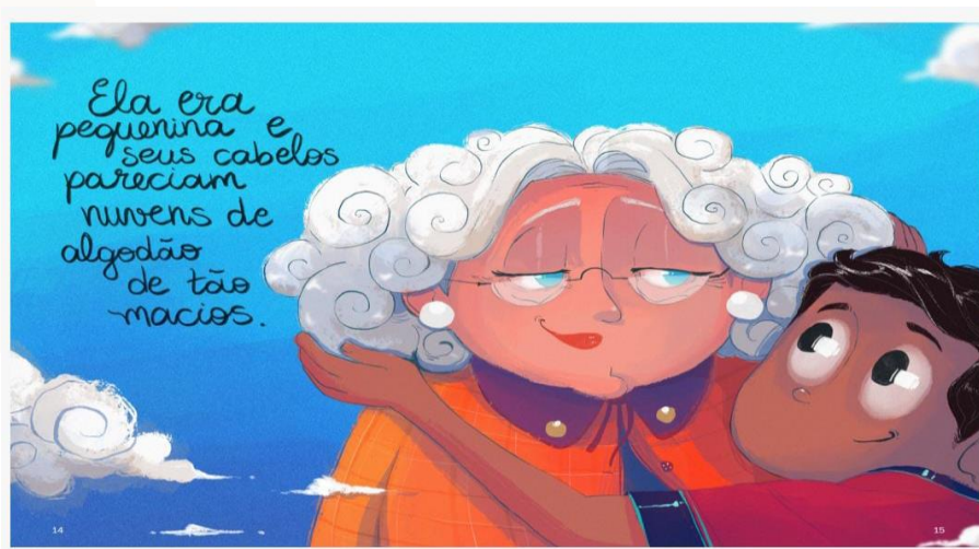
Figura 4: Minha Avó de 100 anos

E assim, ao longo de mais de 40 páginas, Minha avó de 100 anos conta episódios do encontro e da convivência entre um menino e sua avó de 100 anos. Dessa forma, a criança que é apresentada como uma criança feliz se declara ainda como uma criança privilegiada por conviver com sua avó, uma senhora pequenina, de cabelos parecidos com nuvens de algodão, demonstrando a riqueza plástica do livro ao associar a maciez e brancura dos cabelos a avó às nuvens.