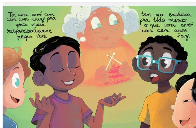
Figura 3: Minha Avó de 100 anos

Minha avó de 100 anos conta a história de um menino que narra a oportunidade, que do seu ponto de vista é uma oportunidade mágica, de conviver com a avó de 100 anos, o que causa espanto e curiosidade entre as pessoas, especialmente aos amigos da sua idade, para quem ele faz questão de falar sobre essa experiência. O que se destaca nessa primeira imagem é o olhar que o menino/narrador lança sobre o leitor, como uma espécie de convite para conhecer sua história junto com essa avó de 100 anos. Ao mesmo tempo que o “Era uma vez...” introduz a história, o olhar do menino convida o leitor a também fazer parte dessa história.