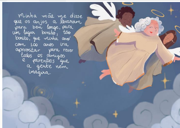
Figura 7: Minha avó de 100 anos

Destaca-se nesta parte da narração, a ênfase no papel da mãe como o apoio que a criança precisa para enfrentar a perda com mais entendimento e leveza. E então, a morte como uma espécie de transmutação, algo muito comum em nossa sociedade, atenuam a dor e o trauma que podem ser traumáticos na formação de uma criança.