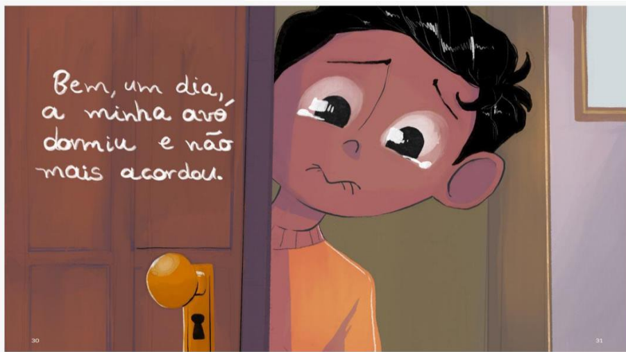
Figura 6: Minha avó de 100 anos

De acordo com o texto e as ilustrações das páginas destacadas, na perspectiva daquilo que a autora entrega ao público, o luto e a morte são encarados pela criança não apenas como uma relação de perda, mas como uma parte do ciclo natural da vida. E assim, Minha avó de 100 anos poderia ser lido como um livro que, simbolicamente direcionado às crianças, se revela como obra a ser recepcionada pelo público de todas as idades.